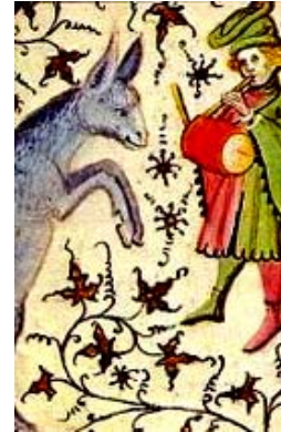
Ezelsmis & Ezelsfeesten

http://www.youtube.com/watch?v=ySXYoKockpQ