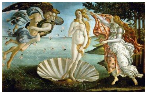
5. Sandro Botticelli, Geboorte van Venus, 1480