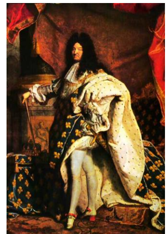
9. Hyacinthe Rigaud, Lodewijk XIV, 1701