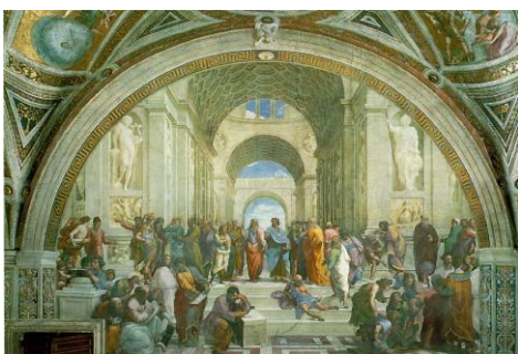
7. Raphael, De school van Athene, 1511