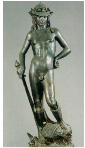
3. Donatello, David, 1425-1430