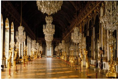
10. Spiegelzaal, Versailles