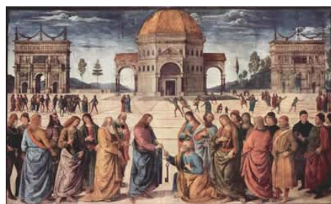
8. Pietro Perugino, De overhandiging van de sleutel, 1482