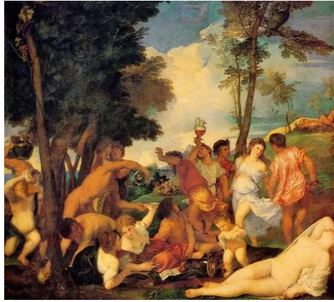
11. Titiaan, Bacchanaal, 1518