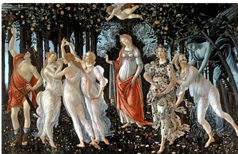
16. Sandro Botticelli, Primavera, 1482