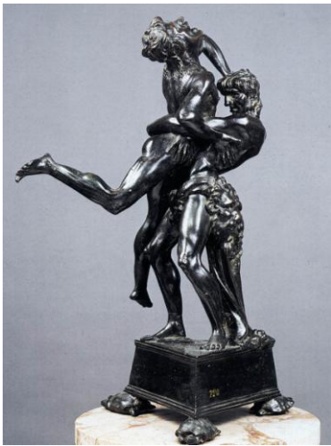
13. Antonio del Pollaiuolo, Hercules en Antaeus, 1475