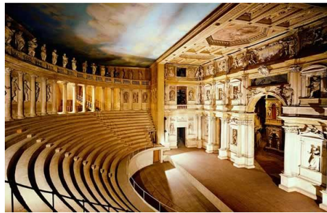
14. Andrea Palladio, Teatro Olimpico, 1585