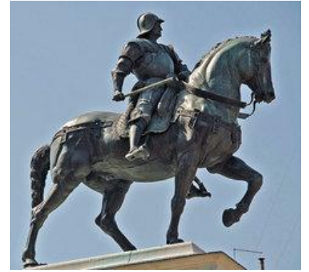
12. Andrea del Verrocchio, ruiterstandbeeld van Bartolomeo Colleoni, 1483-88