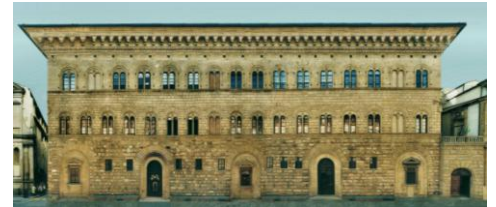
6. Michelozzo, Palazzo Medici-Riccardi, 1444