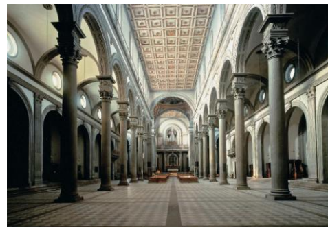
17. Filippo Brunelleschi, San Lorenzo, 1421-69