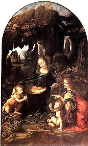
4. Leonardo da Vinci, Madonna van de rotsen, 1485