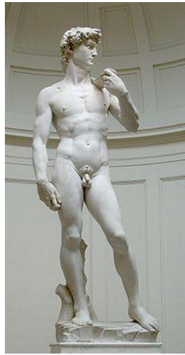
2. Michelangelo, David, 1501-1504