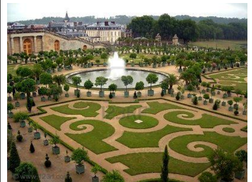
18. Tuinen, Versailles