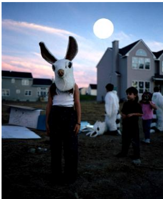
Pierre Huyghe – Streamside day.

Wat moeten leerlingen leren op school, waardoor je hen goed voorbereidt op het leven, werken en leren in een snel veranderende, geglobaliseerde maatschappij? Gardner noemt Five minds als de kern van het onderwijs van de toekomst: the disciplined mind, the synthesizing mind, the creating