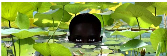
Ruud van Empel – world # 17

Voor de theorie van de Kunsten geldt dat er ook in de professionele disciplines, sprake is van multidisciplinariteit en interdisciplinariteit: grenzen van de theoretische Kunstdisciplines lijken nauwelijks meer afgebakend te kunnen worden door een almaar uitbreidende stroom aan nieuwe invloeden vanuit de film, de fotografie, de mode, de reclame, de psychologie, de filosofie enzovoort. In de theoretische Kunst en Cultuurwetenschappen zijn in de afgelopen jaren debatten gevoerd over wat de belangrijkste onderwerpen en methodes in het hedendaagse kunst en cultuurhistorische onderzoek zouden moeten zijn. Kritische theorieën hebben de ontwikkeling van de kunstgeschiedenis, de theaterwetenschappen, de filmwetenschappen bepaald, waardoor het accent verlegd is van een mono-disciplinaire benadering naar een veel bredere benadering, waarbij kunst