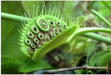
Arvind Palet - Sixes Last - robotplant

Terugkomend op het begrip van hybriditeit: in de actuele Kunst, zie je dat grenzen tussen disciplines vervagen. Kunstenaars zoals Eberhard Havekost (schilderkunst gebaseerd op digitale fotografie),