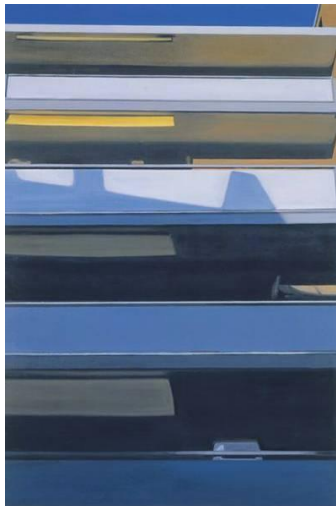
Eberhard Havekost- Stuhl

Voor de praktijk van de kunstvakken zou ik willen bepleiten dat we de wetenschappelijke inzichten over creativiteit op een structurele manier gaan implementeren. Gardner benoemt ook de creating mind als een van de Five Minds . De capaciteit om nieuwe problemen te onthullen en verhelderen en